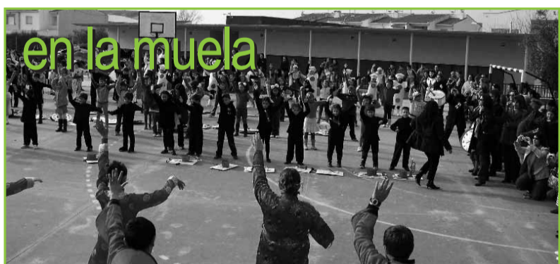
en la muela