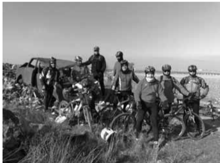
RUTA HACIA VILLAMAYOR DE SANTIAGO

Participará con sus asociados en la concentración de clubes de la comarca, que se celebrará el próximo domingo día 22 de marzo en la Guardia, a las 10,30 horas. El Club ha organizado una ruta en bicicleta para todos aquellos que quieran participar, la salida será como de costumbre desde El Puente Garzón, a las 9 horas. Para que puedan participar todos aquellos que estén interesados, habrá varios grupos, rápidos, y lentos. "ANIMARSE".