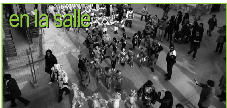
en la calle