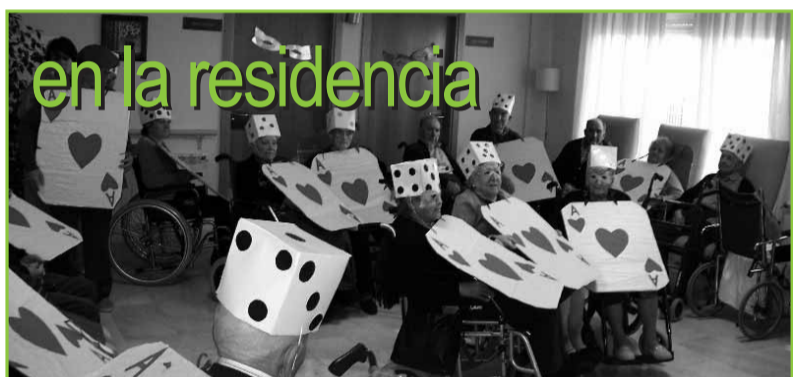
en la residencia

Original: "Las cafeteras" Vestuario: "Mundo Disney" Puesta en escena: "Riansares Gospel Choir" Equipamiento: "Los indios guapetes"